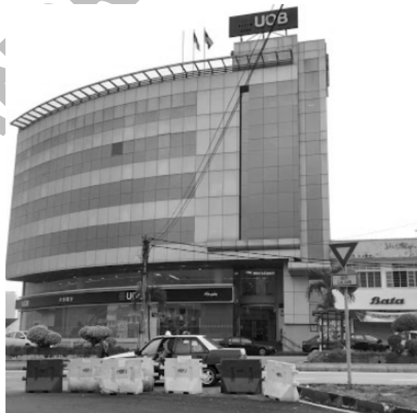
Bank UOB, Old Town, Petaling Jaya