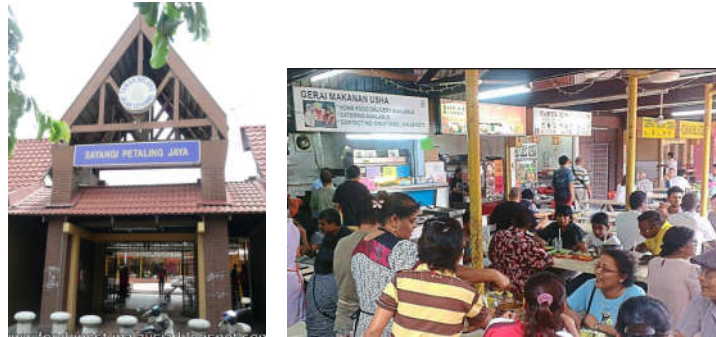
Medan Selera Petaling Jaya

Kegiatan sosial ekonomi pekan 'Old Town' terbahagi kepada dua iaitu aktiviti ekonomi dan kehidupan sosial.