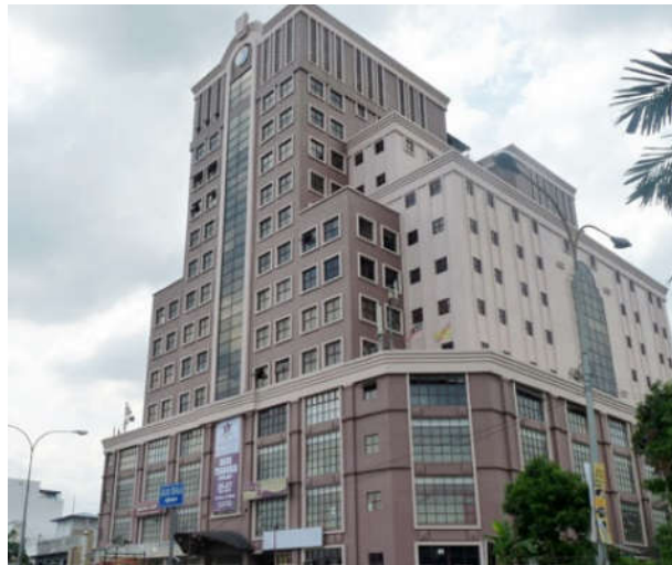
Menara Majestic di Old Town, Petaling Jaya

Penempatan rumah kedai lama di sepanjang Jalan Othman telah diganti dengan kedai pejabat 3 tingkat yang baharu. Akibat perkembang pesat pekan 'Old Town', pelbagai perniagaan baharu turut muncul seperti perbankan, pusat tuisyen, kedai roti yang berlainan daripada perniagaan asal seperti kedai kain dan dan barangan rumah. 'Menara Majestic' yang megah telah dibina di tapak lama panggung wayang. Bank UOB lima tingkat juga tersegam indah di tepi stesen bas 'Old Town'.