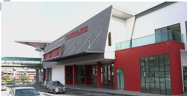
Stesen Bus, Jalan Othman

Pada 20 Jun 2006, Petaling Jaya mendapat status bandar dan majlis tempatan bertukar nama kepada Majlis Bandaran Petaling Jaya (MBPJ).