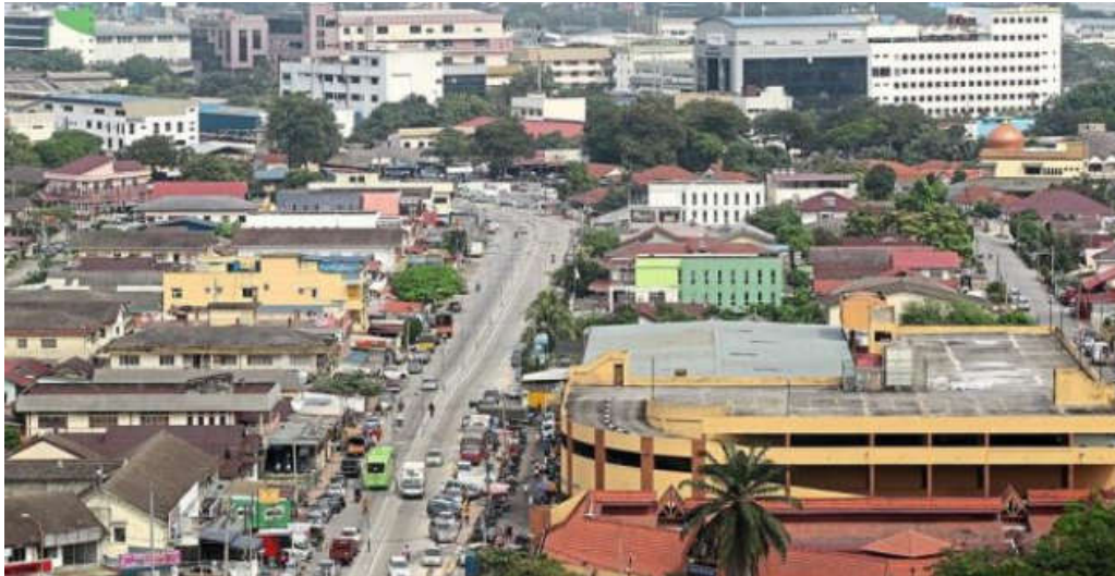
Kawasan Petempatan 'Old Town' Petaling Jaya