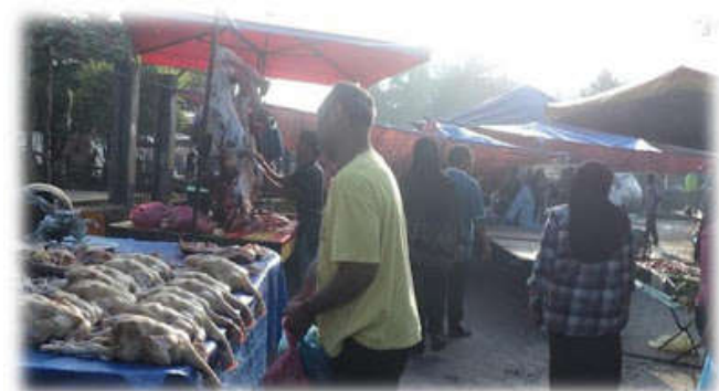
Kawasan jualan barang basah. Lihat susunan ayam yang menarik.