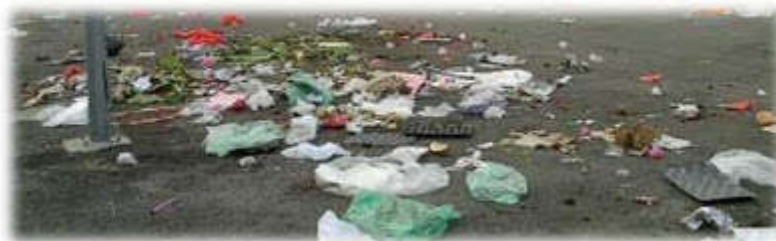
Sampah sarap yang bertarabur dan berterbangan

Kebiasaannya selepas habis berniaga, persekitaran kawasan pasar minggu ini akan dipenuhi dengan sampah sarap. Lebih menyedihkan lagi, sampah – sarap itu akan berterbangan dan berselerak ke tempat lain.