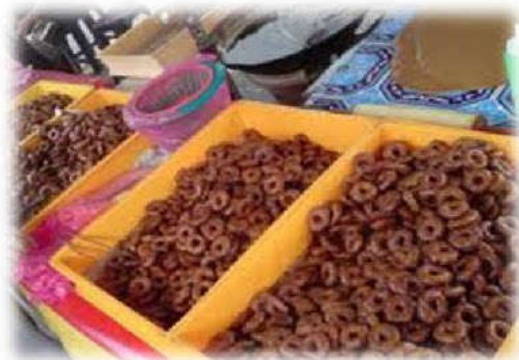
Kawasan jualan Kuih