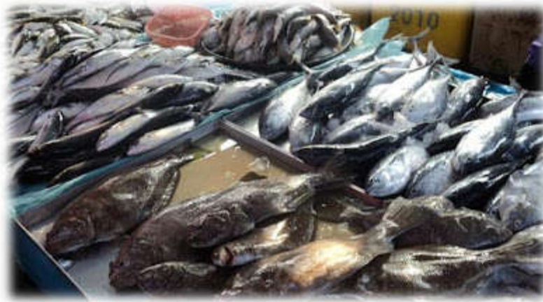
Jualan ikan segar yang tidak diletakkan tanda harga.

Antara alasan yang dilontarkan oleh peniaga apabila harga dengan tiba-tiba yang meningkat ialah 'musim hujan nelayan tak turun laut' , 'laut bergelora' dan sebagainya.