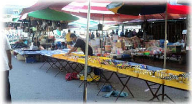
Kawasan jualan barangan dapur.