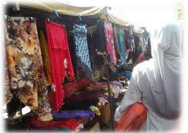
Kawasan jualan pakaian dan terdapat juga pakaian terpakai.