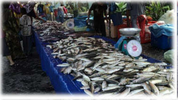
Kawasan jualan ikan.