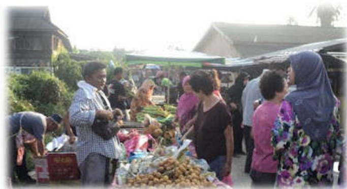
kawasan penjual buah

Berdasarkan kaedah pemerhatian yang saya jalankan berikut digambarkan situasi Pasar Minggu Pokok Sena.