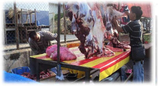
Daging lembu turut di jual.