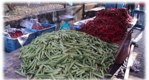
Di akhir masa, kesemua cili dan bendi ini akan habis di jual, termasuk yang dalam bakul tu.